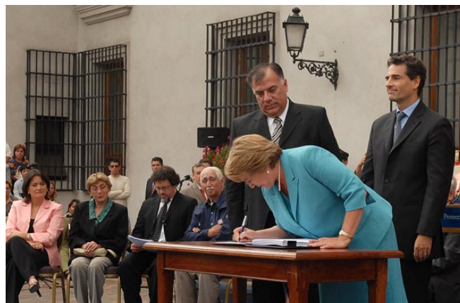
La Presidenta de la República, D a . Michelle Bachellet firma el proyecto de ley sobre Reforma Previsional

10. Más transparencia (garantizar la disciplina y transparencia fiscal).