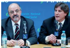
El Director Ejecutivo, Amado Boudou, junto al Ministro de Trabajo, Carlos Tomada

Del acto de clausura participaron numerosas autoridades, encabezadas por el Ministro de Trabajo, Empleo y Seguridad Social, Dr. Carlos A. Tomada y el Director Ejecutivo de ANSES, Dr. Amado Boudou.