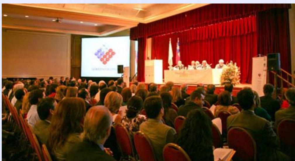
Plenario Prevenia 2009

La OISS, consciente hace años de esta problemática, ha venido impulsando, por sí y a través de la Comisión Técnica Permanente de Protección de Riesgos Laborales, el desarrollo de políticas activas (formación, información, divulgación, sensibilización, etc), con el objetivo de incrementar la dedicación de las empresas para controlar los riesgos para la seguridad y salud de sus trabajadores. Poco a poco, comienza a apreciarse una disminución de los accidentes de trabajo y un mejor reconocimiento de las enfermedades profesionales, pero todavía muy lentamente.