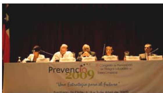
Mesa Plenaria Prevenicia 2009

Tuvo lugar en Santiago de Chile entre los días 1 y 3 de abril de 2009. La finalidad del Congreso fue propiciar el intercambio de conocimientos y experiencias, reunien-