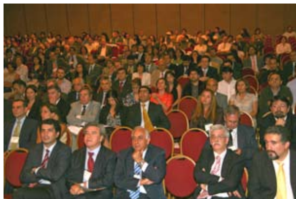
Asistentes Prevenicia 2009

do a todos los agentes Iberoamericanos comprometidos con la reducción de la siniestralidad laboral y el desarrollo de la Seguridad y Salud de los trabajadores de la Región. Entre ellos, administraciones públicas, organizaciones empresariales y sindicales, mutualidades y administradoras de riesgos laborales, organismos internacionales, entre otras más.