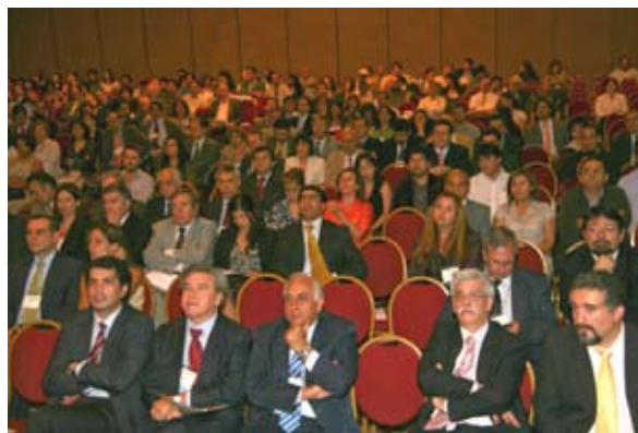
Asistentes Prevenicia 2009

do a todos los agentes Iberoamericanos comprometidos con la reducción de la siniestralidad laboral y el desarrollo de la Seguridad y Salud de los trabajadores de la Región. Entre ellos, administraciones públicas, organizaciones empresariales y sindicales, mutualidades y administradoras de riesgos laborales, organismos internacionales, entre otras más.