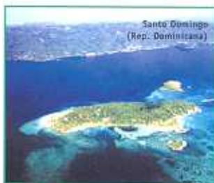
Santo Domingo (Rep. Dominicana)

instituciones, fundamentalmente públicas, de países de la región iberoamericana, para coadyuvar en la modernización de los sistemas de