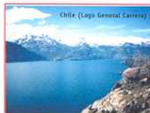
Chile. (Lago General Carrera)

Depois de um ano e meio de atividades, na qual desenvolveram-se cursos 'on-line' e videoconferências, o CEDDET consolida sua estrutura dotando-se de personalidade jurídica própria e incorporando ao setor privado. As atividades da