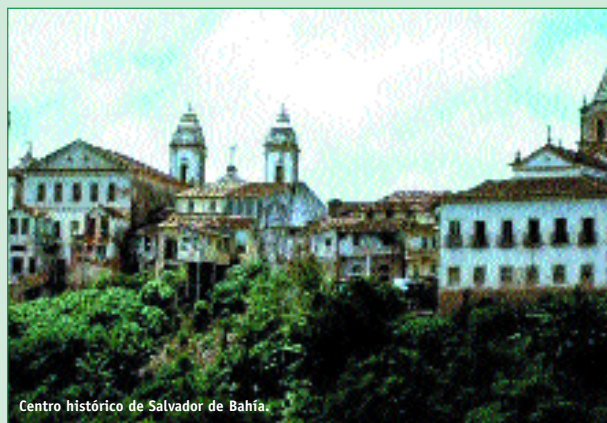
Centro histórico de Salvador de Bahía.