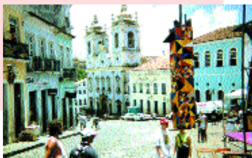
A cidade brasileira de Salvador, Bahia.

de 23 a 26 de março de 2004, datas e lugar que foram ratificados pelo presidente da OISS e ministro de Trabalho e Seguridade Social do Chile, Ricardo Solari Saavera. Além disso, estão previstas várias atividades comemorativas a realizarem-se com motivo do 50º Aniversário da OISS, que são: ● Realização de um Seminário paralelo às sessões