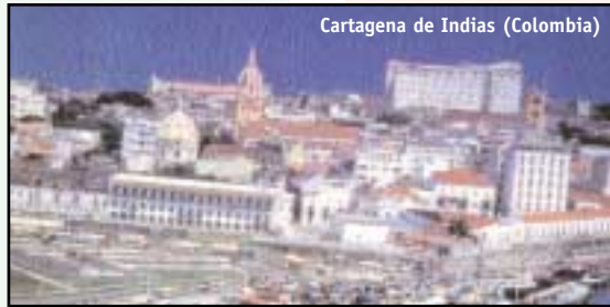
Cartagena de Indias (Colombia)

• El 26 de octubre se celebró el Foro 'Balance Social del Sistema General de Riesgos Profesionales', con el objeto de evaluar los alcances logrados y proyectar los ajustes requeridos del Sistema General de Riesgos Profesionales, con la participación de los Mi-