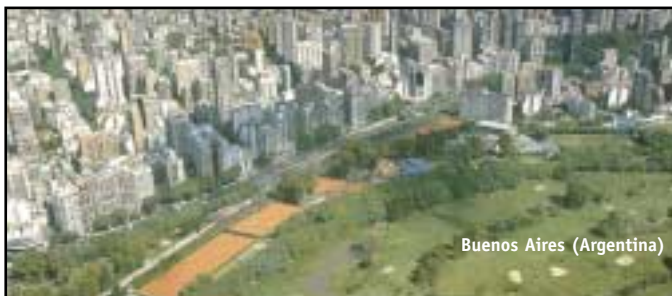
Buenos Aires (Argentina)