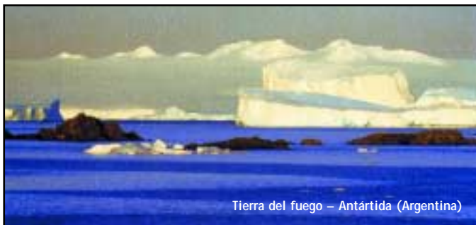
Tierra del fuego – Antártida (Argentina)