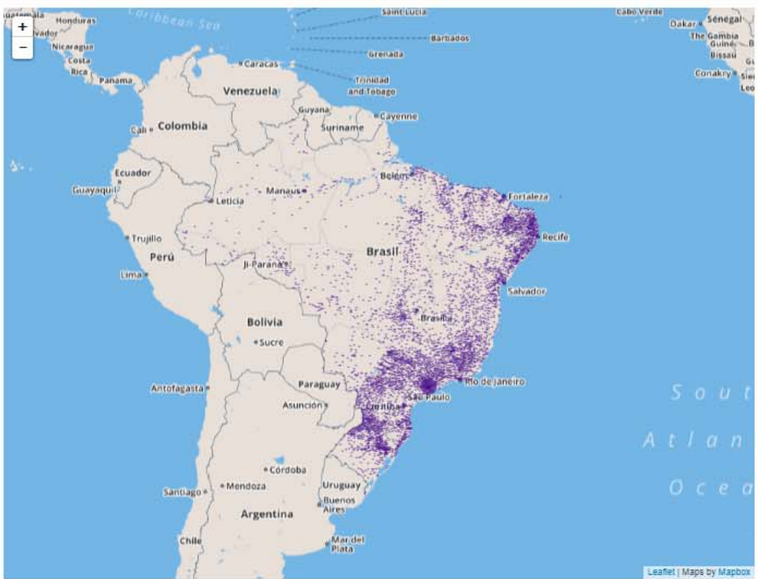
Geolocalização por municípios dos benefícios previdenciários